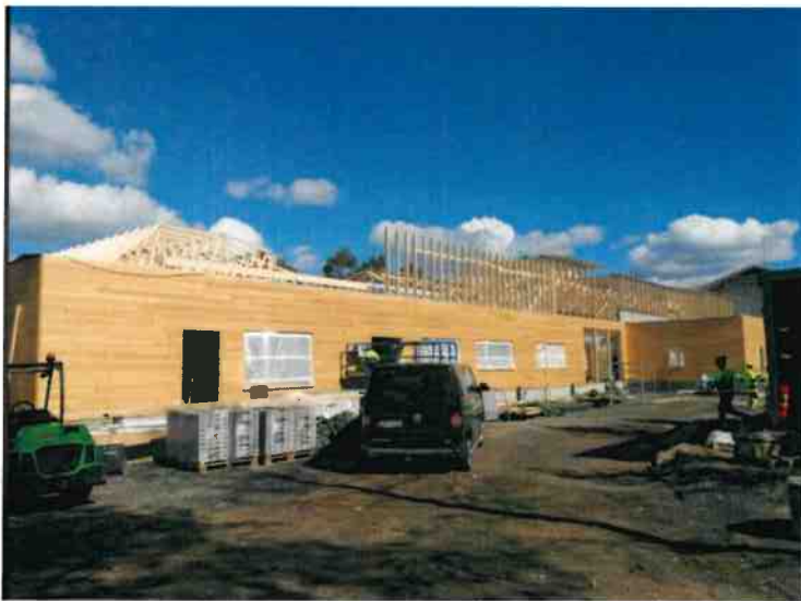
Kuva uuden koulun rakennustyömaalta 13.5.2020