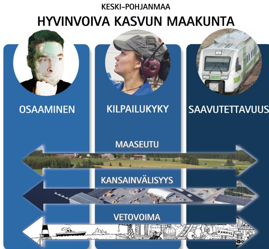
Kuva 3. Maakuntaohjelman kehittämisteemat ja läpileikkaavat painopisteet.

Keski-Pohjanmaan maakuntaohjelman vision mukaisesti Keski-Pohjanmaasta tavoitellaan hyvinvoivaa kasvun maakuntaa (kuva 3). Tavoitetilan saavuttamiseksi maakuntaohjelmassa on kolme kehittämisteemaa: osaaminen, kilpailukyky ja saavutettavuus . Kehittämisteemojen toimenpiteisiin on sisällytetty kolme läpileikkaavaa painopistettä: maaseutu, kansainvälisyys ja vetovoima . Nämä läpileikkaavat painopisteet ovat mahdollistamassa tavoitteiden ja vision toteuttamista jokaisessa kolmessa kehittämisteemassa.