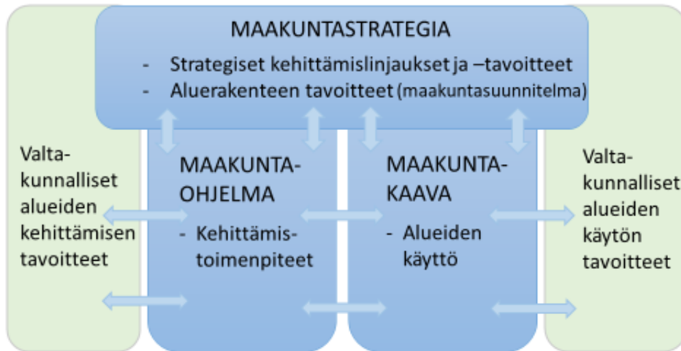
Kuva 2. Maakunnan suunnittelujärjestelmä.