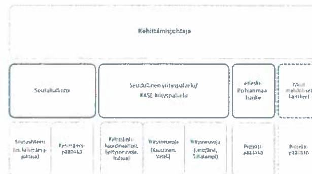
Kuva 3. Kaustisen seutukunnan henkilöstö vuonna 2018

Seutukunnan vakituisen henkilöstön määrä on ollut jo vuosien ajan viisi henkilöä. Lisäksi on määräaikaista henkilöstöä projektien määrästä riippuen, vuonna 2017 kolme henkilöä, joista yksi osa-aikainen. Vuonna 2018 vakituisen henkilöstön määrä nousee kuuteen henkilöön, kun Toholampi tulee mukaan KASE Yrityspalveluun ja Toholammin Kehitys Oy:n yritysneuvoja siirtyy Kaustisen seutukunnan työntekijäksi. Vuonna 2017 yritysneuvontaa on Toholammin osalta toteutettu määräaikaisella ostopalvelusopimuksella. KASE Yrityspalvelu on vastannut Toholammin yritysneuvonnasta, mutta samalla seutukunta on ostanut lisää henkilöstöresursssia Toholammin Kehitys Oy:ltä. Syksyllä 2017 on valmisteltu ratkaisuja, joilla voidaan vastata elinkeinoelämän lisääntyneeseen kehittämistarpeeseen sekä työllisyysstrategian toimeenpanoon. Yhtenä keskeisenä keinona on nähty seutukunnan (henkilö)resurssien lisääminen, sillä nykyisellä henkilöstöllä ja kehittämisjohtajan työpanoksen puutteen johdosta on haasteellista vastata kaikkiin kehittämistarpeisiin.